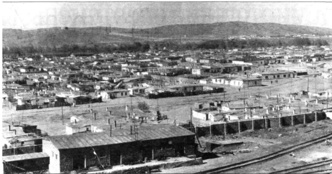
Поселок Самаркандский, 1946 год. На переднем плане забор Казахского металлургического завода и улица Карагандинская. В правом верхнем углу - мясокомбинат, расположенный в районе гидроузла на правом берегу водохранилища

Еще одна дата в летописи Темиртау приходится на 1944 год - в поселке Самаркандском появился первый лагерь для военнопленных. В начале 1944 года в Караганду пришел эшелон с немцами, взятыми в плен под Сталинградом, часть из них была направлена на крупнейшие стройки той поры, в том числе и в поселок. Лагерь, в котором они проживали, располагался на улице Панфилова в районе старого кладбища. Он состоял из саманных бараков, обнесенных двумя рядами колючей проволоки. Лагерь для военнопленных было два. Офицерский состав содержался в более благоустроенном лагере, он располагался напротив главной проходной КарГРЭС-1. А бывшие рядовые японской армии жили в лагере на правом берегу, в районе старого мясокомбината. Там же, в ложбине между двумя сопками (где дачи ЛМЗ), было кладбище японских военнослужащих. Еще в 70-е годы на этой территории можно было найти вертикально врытые в землю камни и деревянные столбики, которыми отмечали могилы. Военнопленные немцы и японцы работали на строительстве Казахского металлургического завода, завода СК и объектов соцкультбыта. Например, японцы строили дома, которые находились