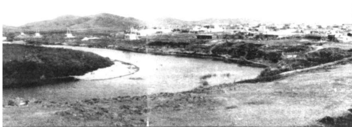
Старое фото поселка Самаркандского. Мы не смогли определить, откуда сделана фотография. Если кто-то из читателей сможет описать снимок, будем рады сообщению по телефону 98-21-26

Старом городе, он был рассчитан на 6 тысяч человек. В этом же году в Темиртау начал работу и первый хлебозавод. Прав-