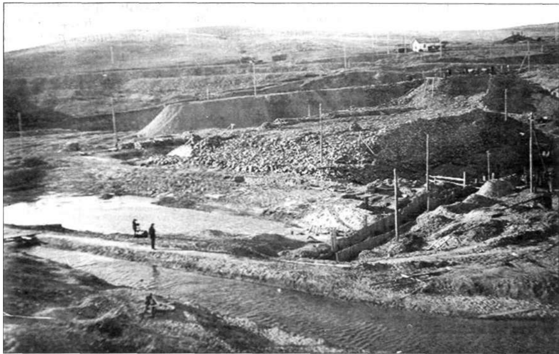
1935 год. Строительство КарГРЭС-1

Интересен и такой факт: с 1909 года на землях будущего Темиртау постоянно жили казахи, русские, немцы, белорусы, украинцы, эстонцы, литовцы. С 1909 года селение Самаркандское начало крепнуть, люди в нем, по свидетельству старожилов, жили зажиточно, держали огромное количество скота, развивали целину. Урожайи были хорошие. Переселен-