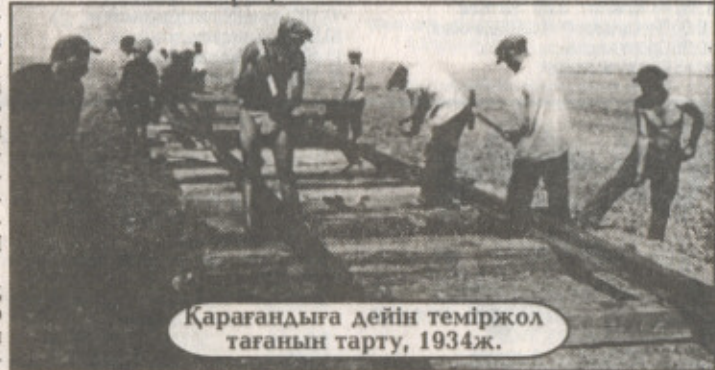
Қарағандыға дейін теміржол тағанын тарту, 1934ж.

СССР Халық комиссарлар Кеңесі мен Мемлекеттік Қорғаныс комитеті 1942 жылдың 25 қаңтарында жергілікті металл сынықтары негізінде Қарағанды облысында металлургиялық қорыту заводын салу туралы шешім қабылдады. Құрылыс орны ретінде Самарқан поселкесіндегі Қарағандының І-ГРЭС алаңының маңы таңдалды. 1943 жылдың мамырында Қазақ металлургия заводының құрылысы басталды. Қазақ ССР Халық Комиссарлары Кеңесінің осы жылғы 24 қазандағы шешімімен завод құрылысын шапшаңдату үшін үш мың адам жұмылдырылады. Құрылыс халықтық деп жарияланды. Осыдан бұрынырақ 1943 жылдың ақпанында Металлургия заводтары жобалау жөніндегі мемлекеттік Гипромез институты толық металлургиялық циклдағы Қарағанды заводын салу жөніндегі жобалық тапсырманы өзірлеп, оны Қара металлургия халық комиссариатына тапсырған болатын.