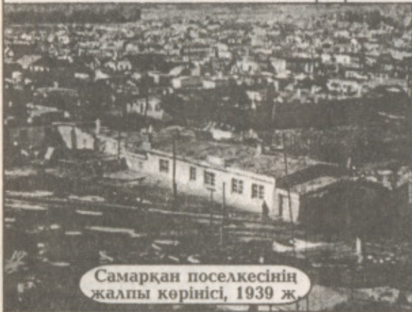
Самарқан поселкесінің жалпы көрінісі, 1939 ж.

өткен ғасырдың басында орталық Ресейден қоныс аударып сулы, нулы жерді таңдағандардың бір шоғыры осы Жауыртау етегін ұнатады. Тарихи деректер «Саратов облысынан көшіп келген алғашқы қоныс аударушылар 1905 жылы Жауырөткел поселкесінің іргетасын қалады» дейді. Көмір кенішінің іргеді болуы, өзен суының молдығы қоныс аударушылардың шаруашылығын шапшаң дөңгелетуіне мүмкіндік береді. 1909 жылы елді мекеннің атауы Самарқан деп