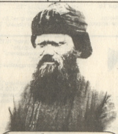
Самара губерниясынан келген алғашқы қоныс аударушы

аталатын құжатында 1942 жылдың мамыр айына дейін кен руда кәсіпорнын жобалау үшін далалы аймақтағы темір рудалары қазба байлығын зеттеудің қажеттігі, әрі металлургия заводын салатын орынды анықтау, жалпы құрылыс ауқымының көлемін көрсету, өндірістің іске кірісу мерзімін белгілеу туралы басқа да мәселелерді қарастыру жайы әңгіме етілген.