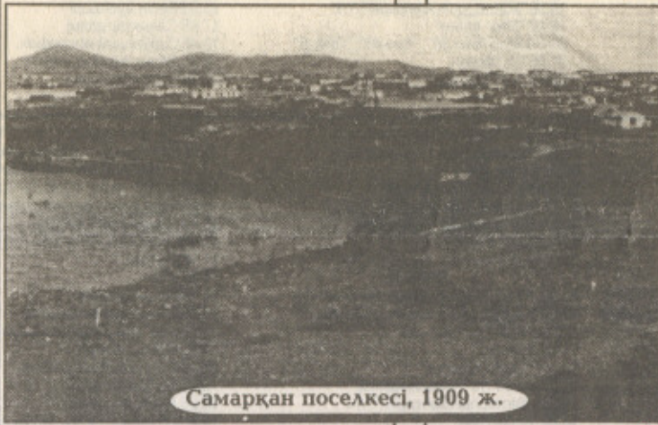
Самарқан поселкесі, 1909 ж.

Арқаның солтүстігінен басталатын жазық дала осы тұсқа келгенде жатаған шоқы, төбелермен ұласады. Әрі сол кездегі суы мол Нұра өзенін жағалай қоныстанған жергілікті халық бір шыбық өспеген төбені Жауыртау (кейбір деректерде Жауырөткел) деп атаған. Ол кезде Нұраның жағасында ат бойы құрақ өсетін. Жазық даланың орта тұсындағы осы төбе сырт көзге биік тауға ұқсап, кез-келген жолаушыны өзіне тартатын. Бұл жер жергілікті халықтың жайлы мекені еді. Алайда