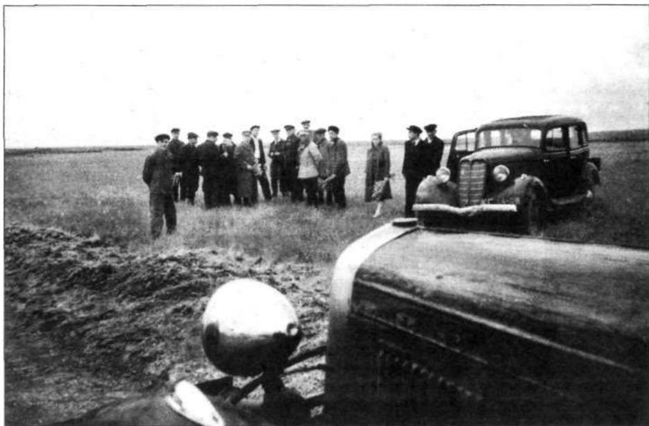
На этом участке теперь расположен центр Темиртау

Handwritten notes and signatures in the top right corner of the page, including the name 'Татьяна Хмелева' and other illegible text.