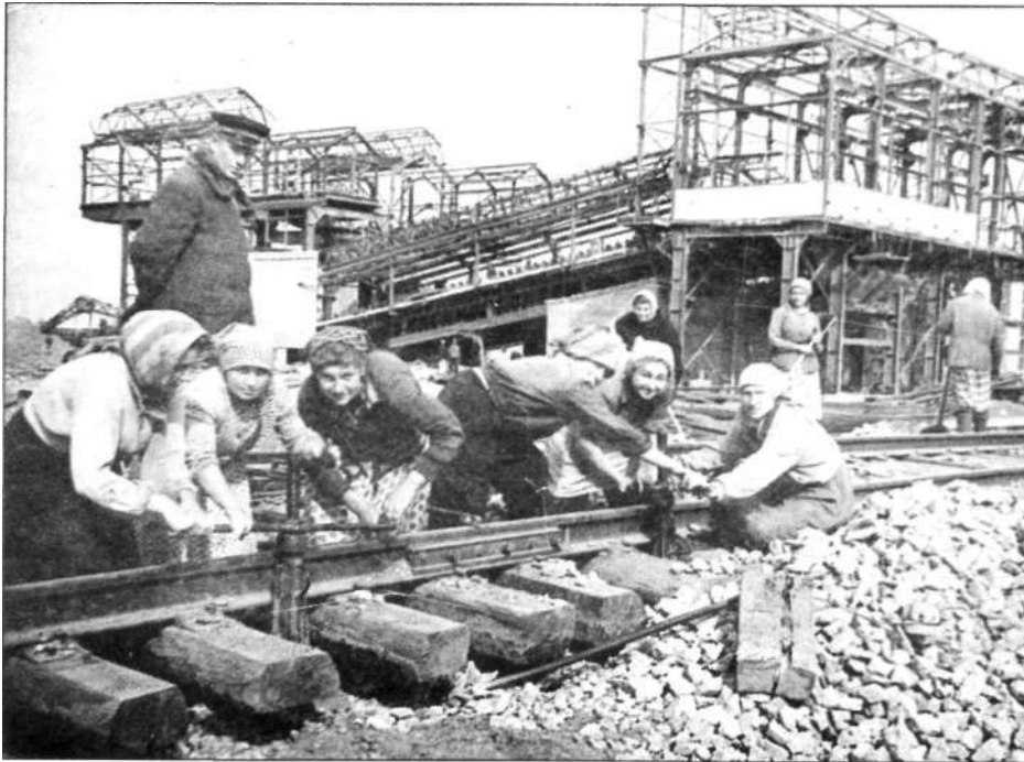
План набора на стройку к лету 1959 года был значительно перевыполнен. Около трех тысяч человек оказались лишними