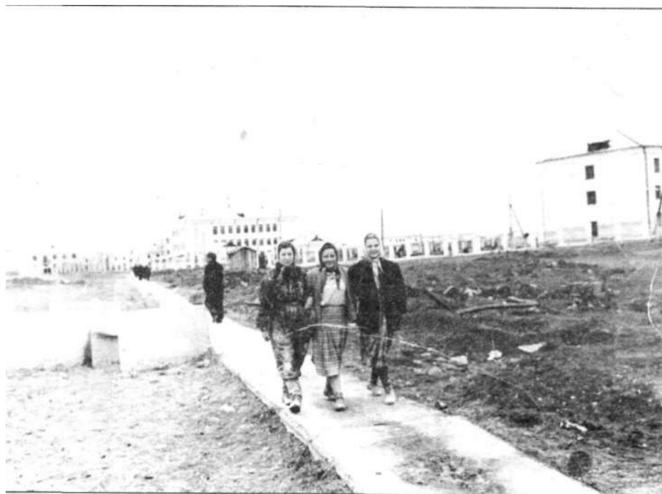
На строительство Казахстанской Магнитки только в 1958 году приехало 8,5 тысячи комсомольцев из всех республик СССР. В августе 1959 года их уже было больше 20 тысяч