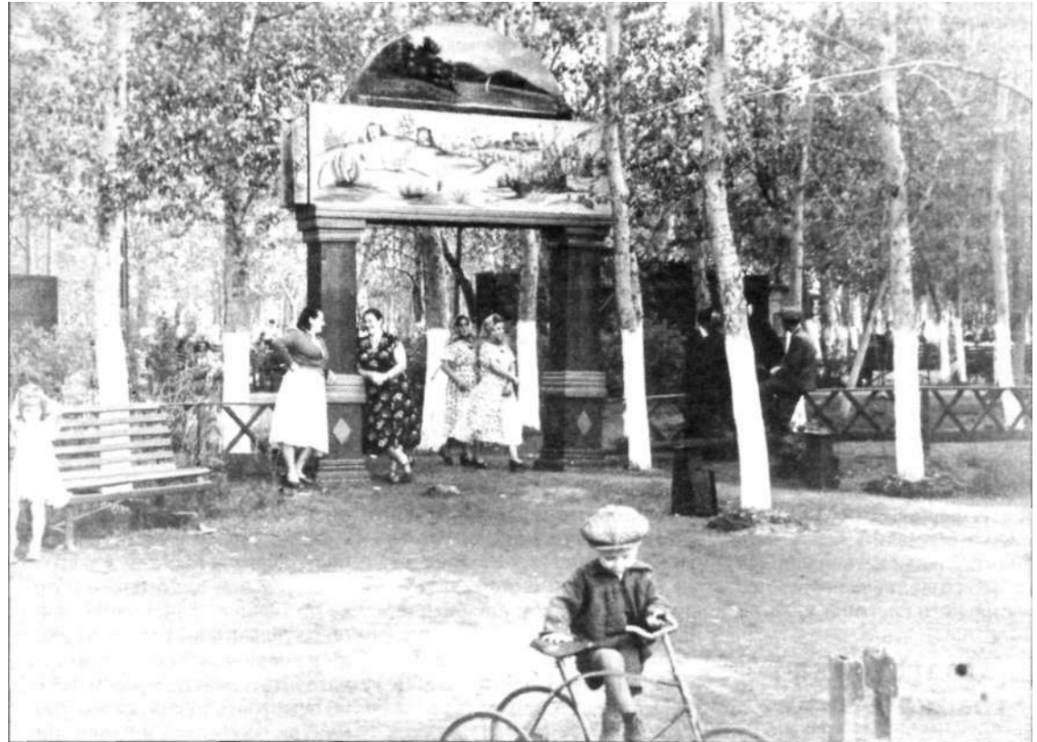
Парк в Старом городе

- В 1909 году на переселенческом участке Жауыр-Брод был образован поселок Самаркандский. Жителями поселка были немецкие семьи, прибывшие из центральных районов