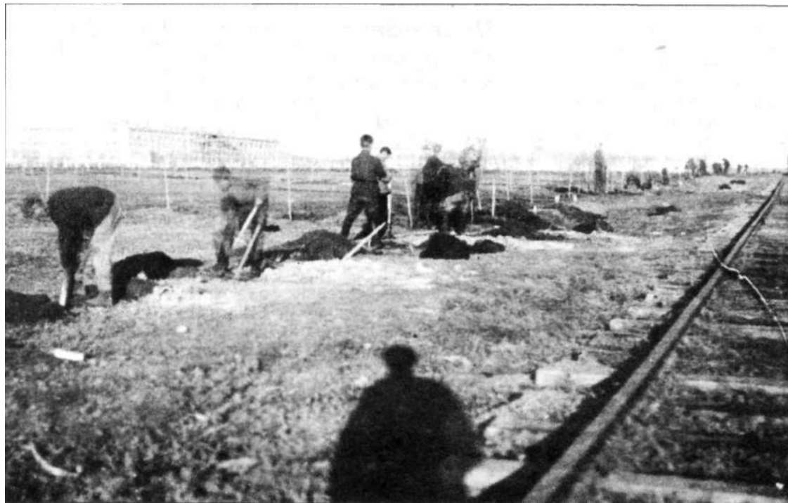
1938 год. Первая аллея парка в Старом городе