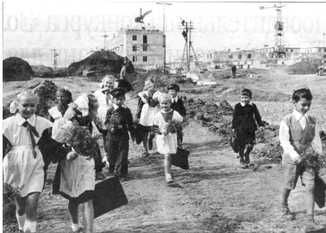
Снимок знаменитого советского фотографа Семена Фридлянда, который работал в журнале «Огонек», сделан в 1957 году на проспекте Строителей. Одна из жительниц Темиртау, придя в музей, узнала на фото себя

В 2000 году в здании бывшего детского сада «Фонарик» разместился детский дом «Айналайын». Поздравить педагогов детского дома и его первых воспитанников с открытием приезжала первая леди страны Сара Назарбаева. Улица Калинина вообще изначально была богата образовательными учреждениями