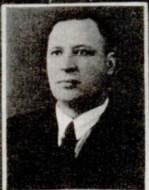
Директор Безменского Ленинского техникума