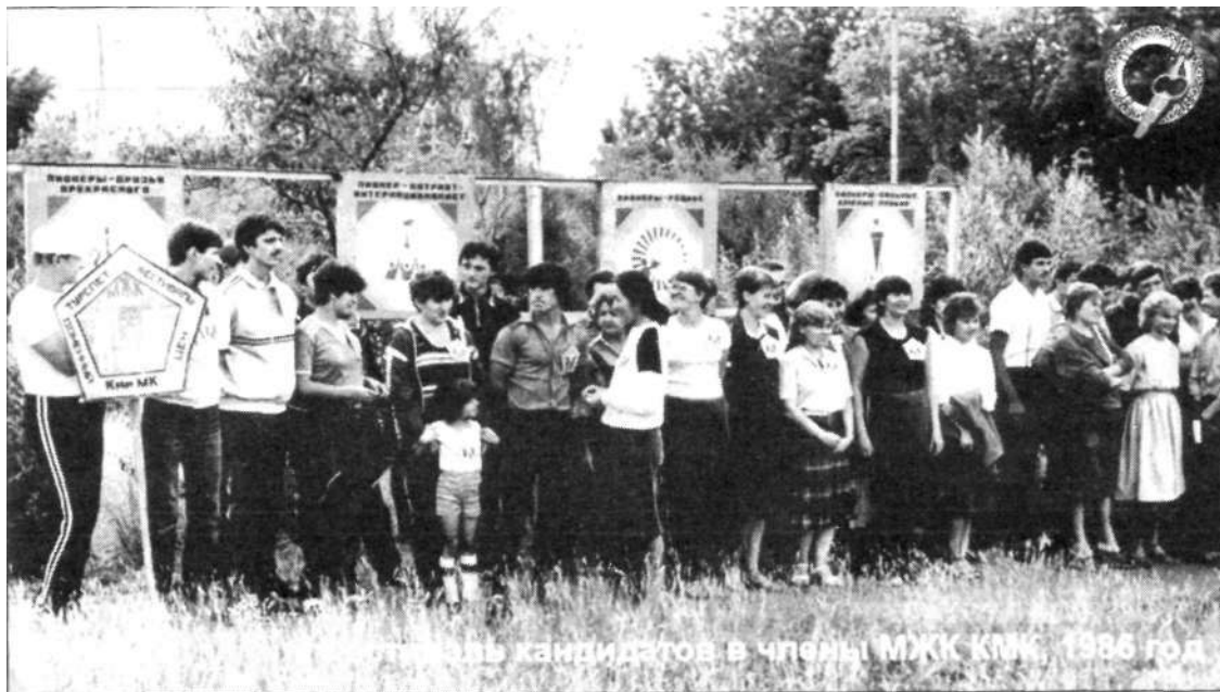
Музыкальный ансамбль кандидатов в члены МЖК КМК, 1986 год