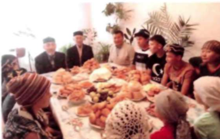
«Айналайын» балалар үйіне қайырымдылық көмек жасалды