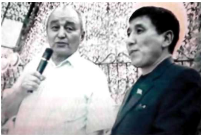
Айтылды ақ тілек жылы лебіз. 15.09.2001 ж «Асқар және Компания»-ға 10 жыл

Қайнаған сорпаның бетіндегі көбікті алып тастасаң майы қалады. Мұрағаттың қазанын ашып қарасаң осындай олжаларға белшеңнен батасың. Бұл соның бірі ғана.