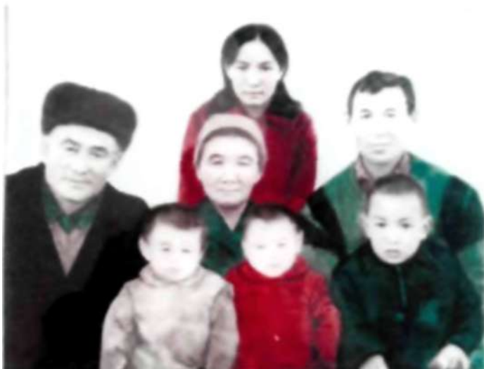
Ата ана ұрпақтатары ортасында