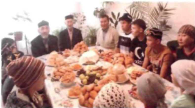
«Айналайын» балалар үйіне қайырым көмек жасалды