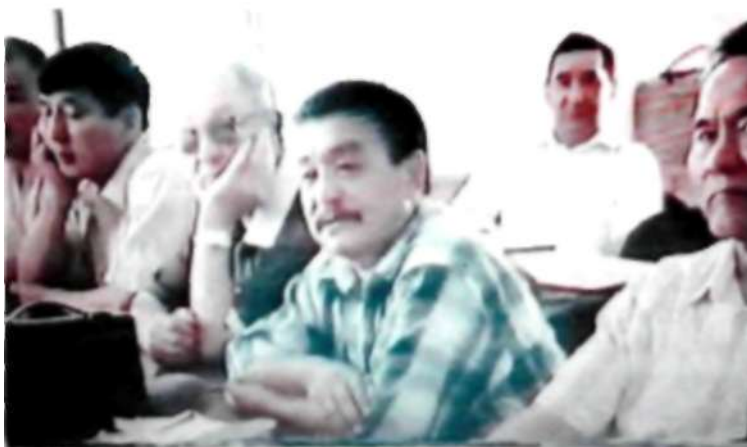
Ақсақалдар алқасын құру туралы алғашқы жиын

Топтарын жазбаған ақсақалдар мұсылмандар мешітінің бой көтеруіне, ұлттық тіліміздің аясын кеңітіп өркендеуіне бірден бір себеп іс қағаздардың ұлттық тілде рәсімделуіне, өскелең ұрпақтарымыздың ұлттық өз тілінде білім алу үшін қазақ мектептерінің санын арттыру, жастардың тәрбиесіне ата салты, дәстүрлі қағидаларды сыналап еңгізу оны нәсихаттау үрдісін өмірмен байланыстыру сияқты келелі істердің жолын қарастырып мәселелер қозғап жергілікті биліктерге шығып көптеген жетістіктерге жетті. Бұл игі істер ақсақалдардың ортасында бұрын соңды болмаған бастау жол екендігін айқын көрсетті. Аңғарғанымыз жұмыла кіріскен ақсақал аға буын қауымдастың мақтауға тұрарлық мерейге толы сауапты істері еді. Игілігін ұрпақтарымыз болып халқымыз көріп жатыр.