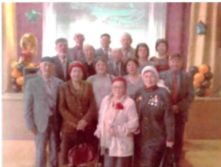
Қуанышты сәттердің бір көрінісі. 2016 ж.