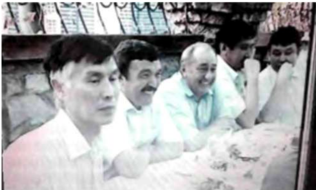
«Асқар және Компания» ЖТС - нің 10 жылдығының қонақтары