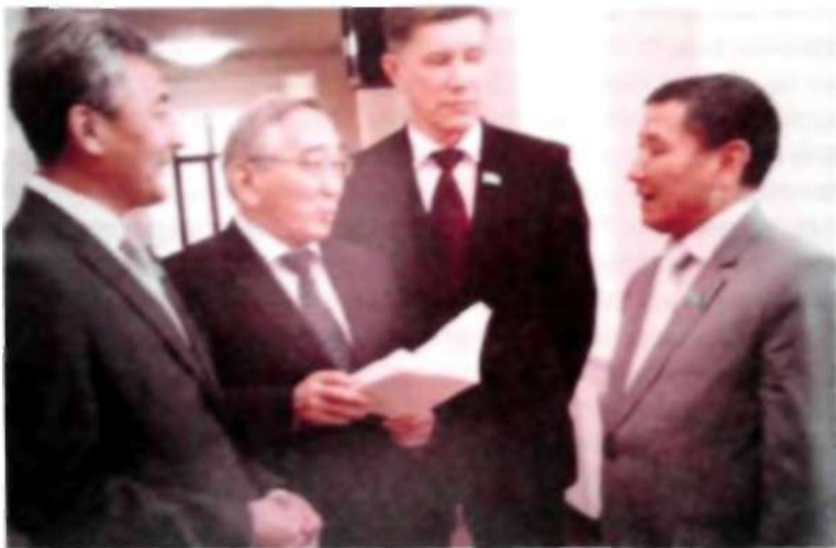
Фракция мүшелерінің кездесу сәті