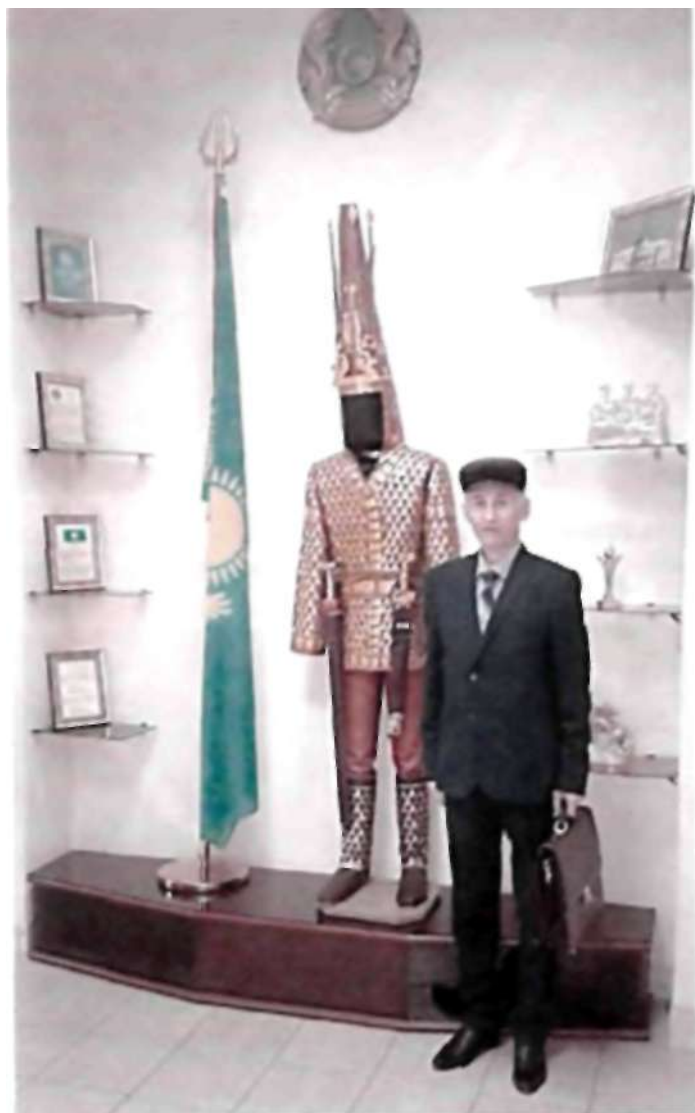
«Асқар и К»-ның шағын мұражайындағы «Алтын адам» бейнесі