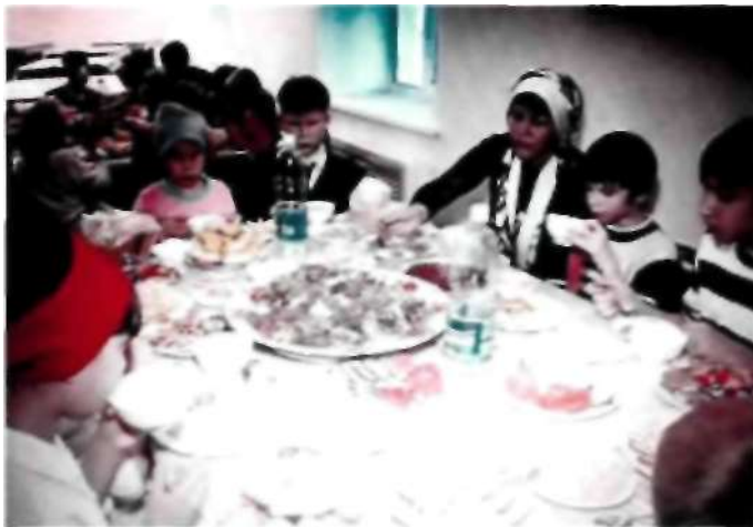
«Құрбан айт» асына «Айналайын» үйінің жетім балалары шақырылды