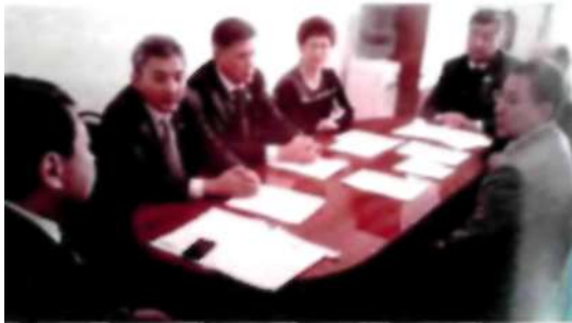
Бюджет және қаржы жөніндегі тұрақты комиссияның кезекті отырысы 2003 ж.

Мен алғашқы сессияда «Бюджет және қаржы жөніндегі тұрақты комиссияның мүшесінің құрамына өттім.