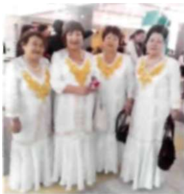
«Магнитка» Ансамблінің әншілері