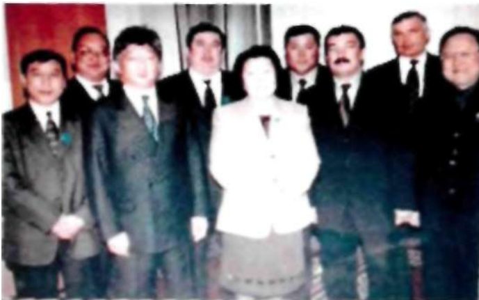
Сара Назарбаеваның Теміртауға сапары. 22. 12.2000жыл