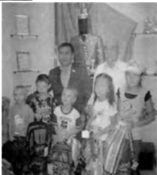
«Мектепке жол» акциясы аясында оқушыларға көмек жасалды