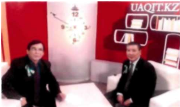
Уақыт бағдарламасына сұхбат беру кезі