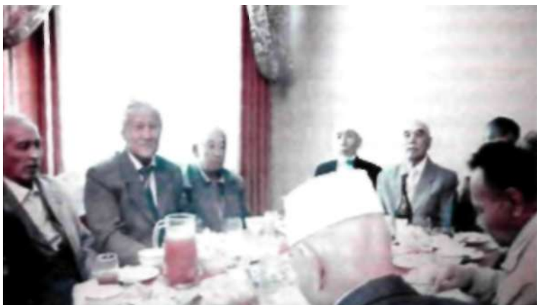
9май 2012 ж. Жеңіс тойы күні. «Бота» кафесі Металлург достарымен бірге