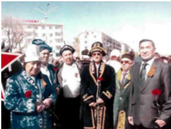
Жеңіс мерекесі. 09.05. 2014 ж.