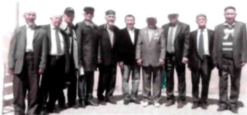
Ақсақалдар алқасының құрамы. 2016 ж.