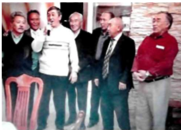
Ақсақалдар «Теміртау жастары» әнін шырқап тұрған сәті