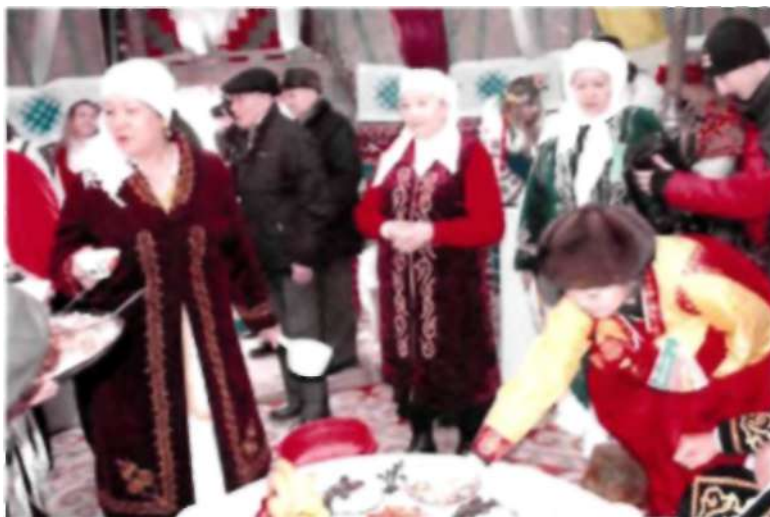
Наурыз мерекесі. 2014 жыл