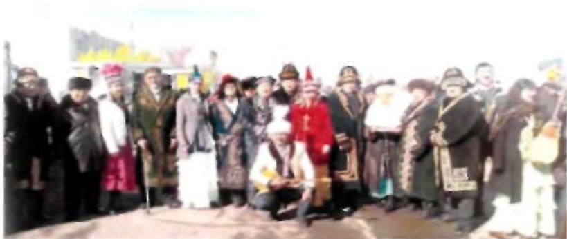
Ұлттық мереке ұлттық рухтың жебеуіне сүйенеді. 22 Наурыз 2016 ж.