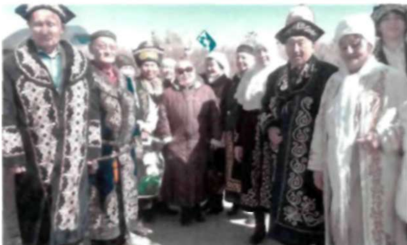
9 Мамыр жеңіс мерекесі күні. 2017 ж.