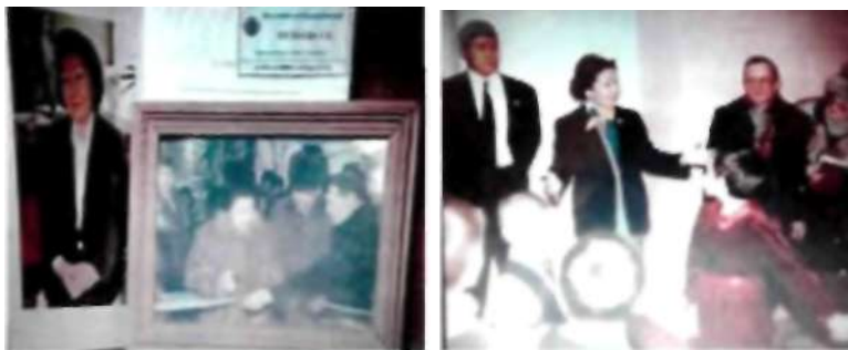
Бөбек қорының президенті Сара Назарбаеваның «Айналайын» балалар үйінің балаларымен кездесуі