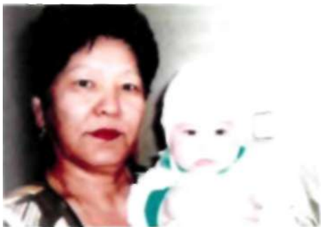
Сауле және немересі

Еңбек жолын Тұрмыс-қажет көрсету комбинатында кассир-бухгалтер қызметімен бастап табысты еңбек етті.