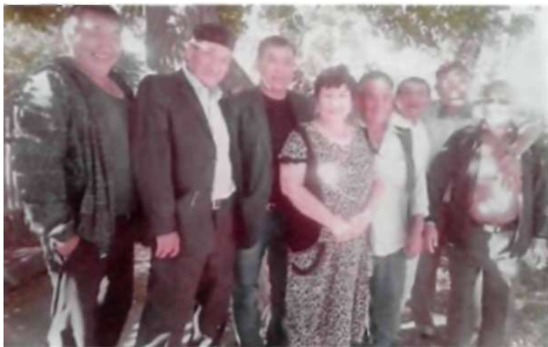
Асқар туысқан ағайындарымен бірге