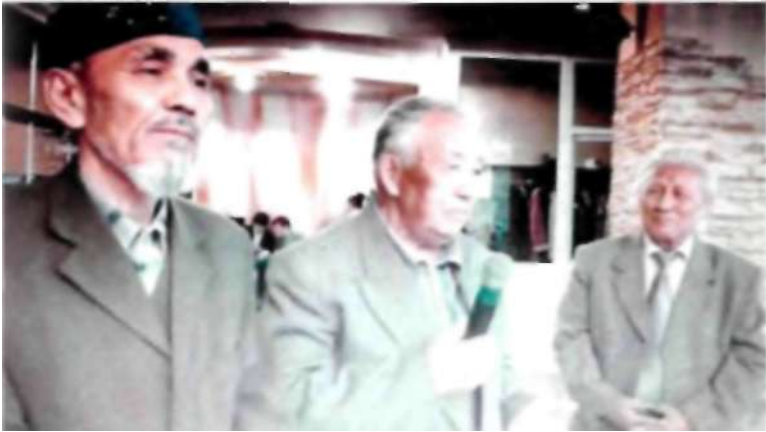
9 май 2012 ж. Жеңіс тойы қарсаңында «Бота» кафесіндегі мерекелік дастархан үстінде металлург достарымен бірге