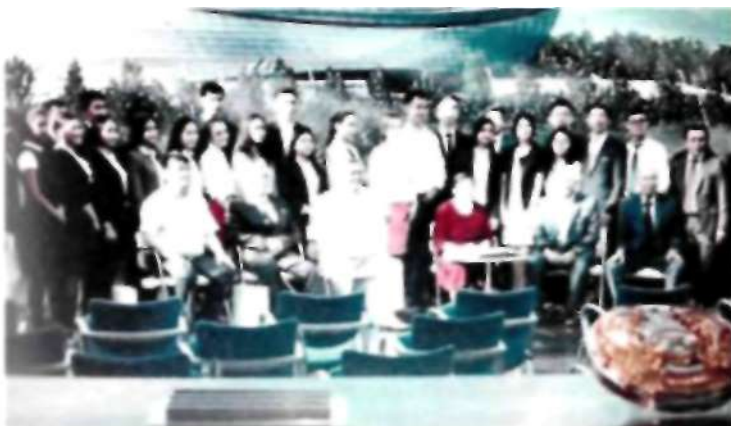
Президенттің курстастары, үзеңгілес достары "Елі сүйген, елін сүйген Елбасы» атты іс шараға қатысқан жастардың ортасында. Шілде 2017ж.