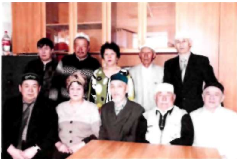
Гагарин ауылының ақсақадарымен кездесу сәті