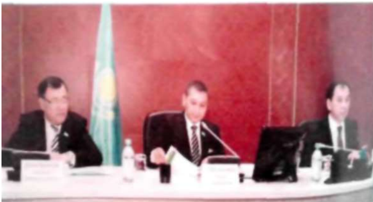
Обылыстық депутаттардың отырысы