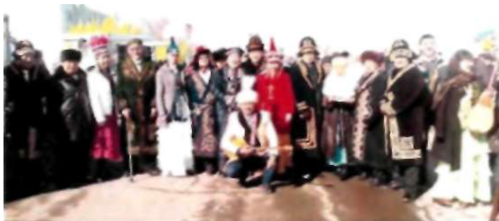
Наурыз мейрамы. Теміртау қ. 2017 ж.