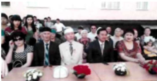
Мектепке жол мерекеге қатысқан ақсақалдар № 5 мектепте. 01.09.2015 ж.