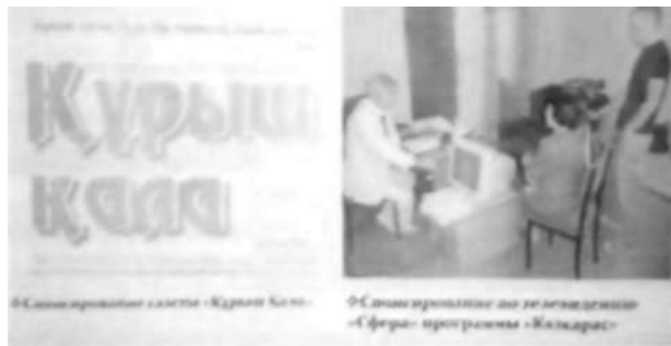
БАҚ - на спонсорлық көмек көрсетіп келді