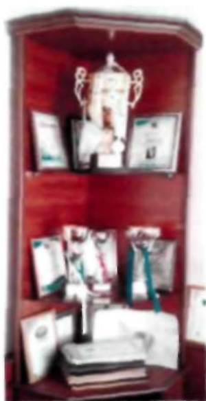
"Асқар и К» футбол командасы және жүлде сыйлықтары мен кубогы