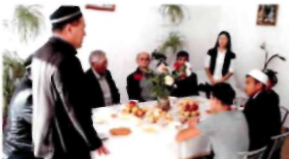
«Айналайын» балалар үйіне шалынған құрбандықты тапсыру несі. 2017 ж.