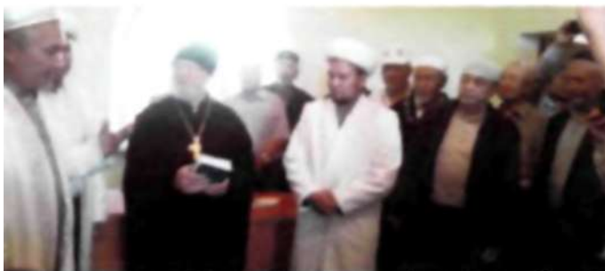
Қалалық орталық мешіт қасында «Сауат ашу орталығы» ашылу рәсіміне ақсақалдар алқасы қатысты. 2017ж.