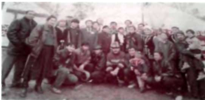
Дүниежүзілік қазақтарының бірінші құрылтайына қатысушылар

Зайыбы 17 жыл бұрын пәниден бақиға аттанған. 5 баланың анасы. Көп балалы «Күміс алқа» иегері. Әдебиетке үйір зейнеткер ананың әлі де талай жаңалықтар арқылы оқырмандармен қауышуына сенім артамыз. Шығармашылық жолыңызға сәт сапар. Өміріңіз қуанышқа толып бай қуатты ғұмыр кешіп Дарынды Тұлғалардың Өмірінен тәлім алып алға ұмтыла беріңіз Айтпақшы 1992 жылы Алматы қаласында өткен бірінші дүниежүзілік қазақтардың Құрылтайына қатысқан қуанышыңызға ортақпыз.