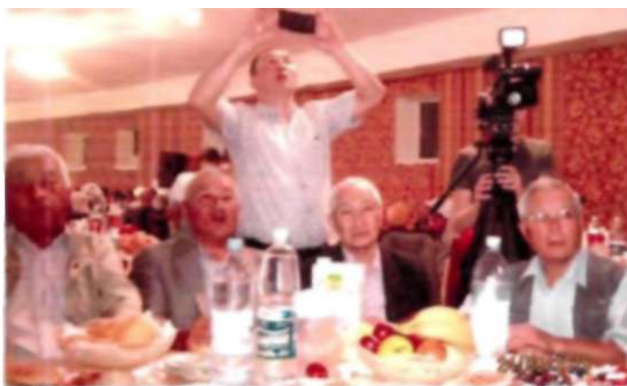
Айт мерекесіне арналып берілген асқа қатысқан ақсақалдар. 24. 06. 2016 ж.