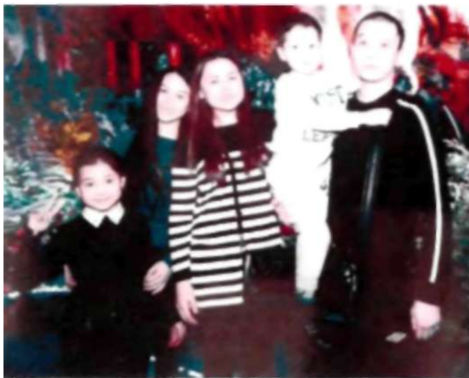
Асқардың балалары және немерелері