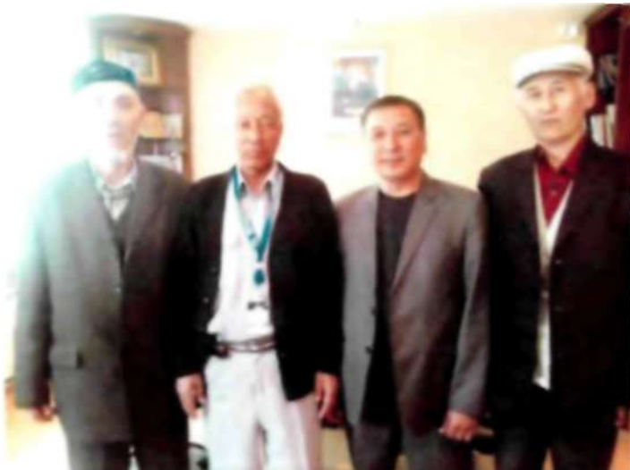
Ақсақалдар алқасының Құрылтайшылары