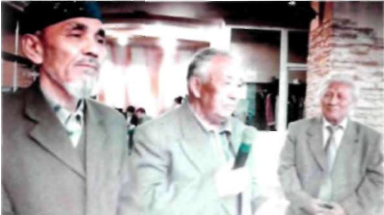
9 май 2012 ж. Жеңіс тойы қарсаңында «Бота» кафесіндегі мерекелік дастархан үстінде металлург достарымен бірге