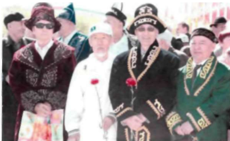
Жеңіс мерекесі. 09.05. 2014 ж.