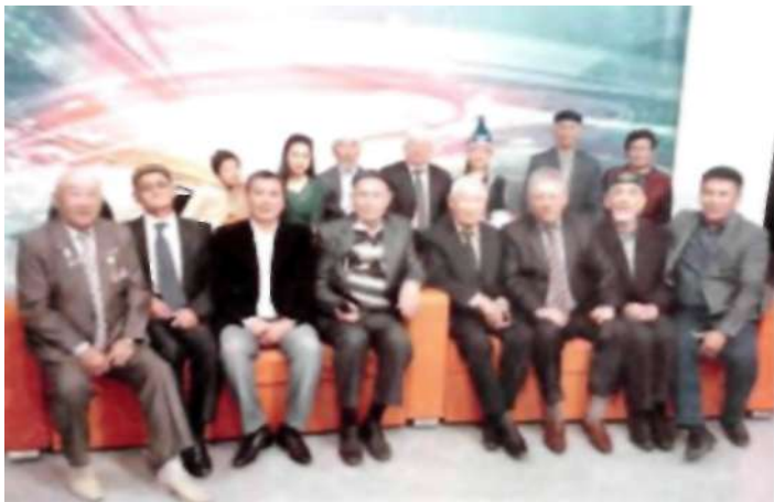
«Шаңырақ» теле бағдарламасына қатысқан Теміртау қалалық ақсақалдар алқасының мүшелері