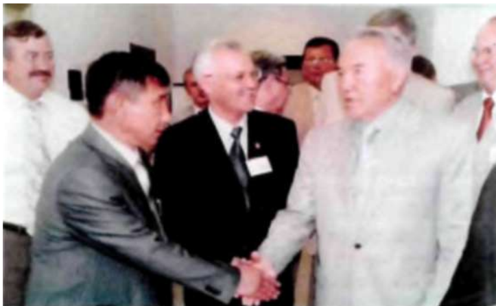
Елбасы Н.Ә. Назарбаевпен кездесу сәті