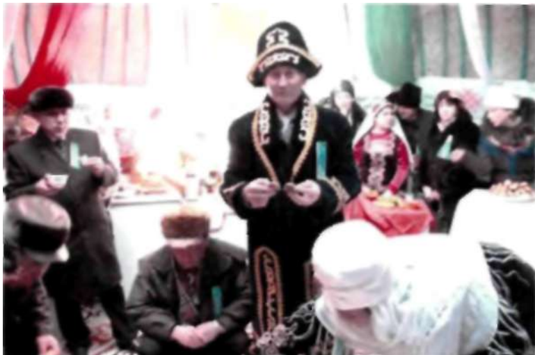
Ұлыстың ұлы күні Наурыз мерекесі. 2014 ж. 22 Наурыз