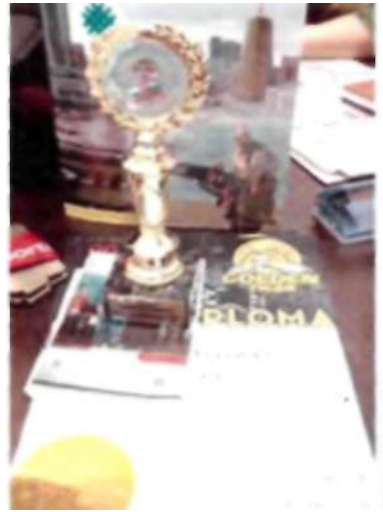
Қарт чемпионның жеңіп алған кубок жұлдесі. 2016 ж.