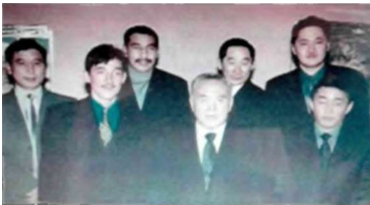
Елбасы Н.Ә. Назарбаев дарынды азаматтармен бірге