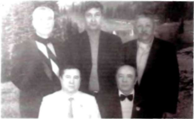
Теміртаулық даңқты спортшылар