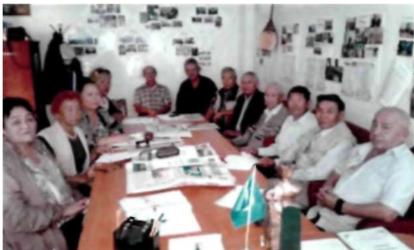
Ақсақалдар алқасы құрамының кезекті бас қосу кезі