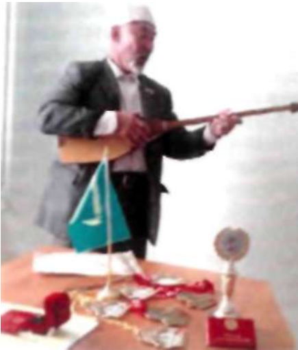
Қарт чемпион «Гауһар тас» әнін шырқап тұрған кезі